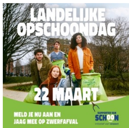
SOCIAL POST 01