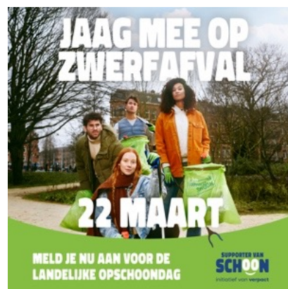
SOCIAL POST 03