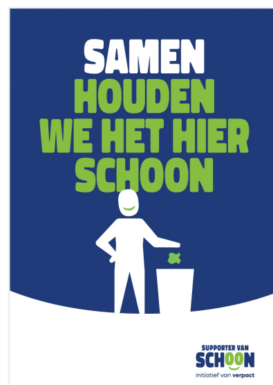
POSTER SAMEN HOUDEN WE HET SCHOON