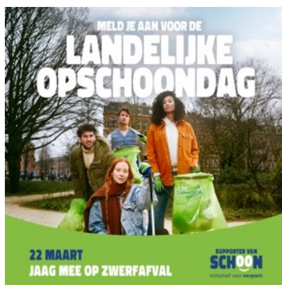
SOCIAL POST 02