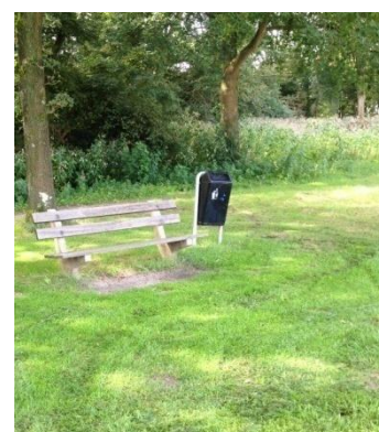
Bij elk bankje een afvalbak?