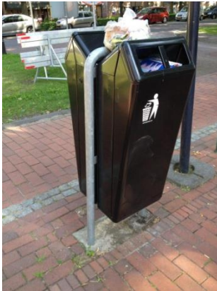
Een extra grote bak in het centrum