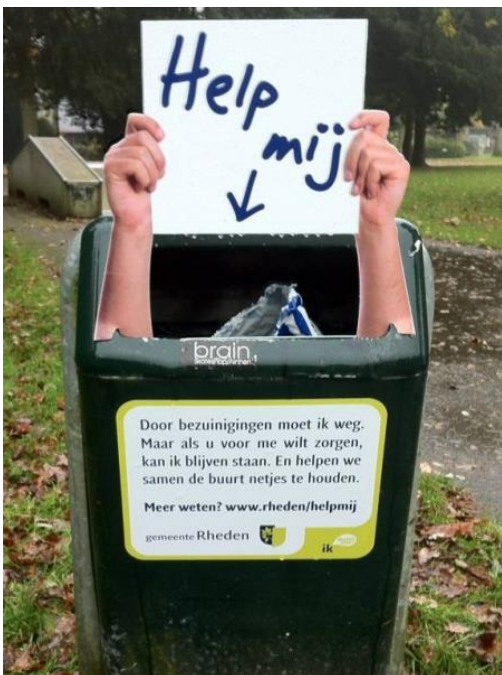
Figuur 1 Gemeente Rheden maakte met stickers op de bakken duidelijk dat de bak weggaat (en waarom). In Rheden is adoptie mogelijk.