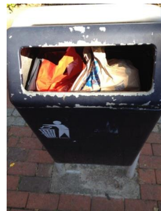
De afvalbakken in het centrum worden goed gebruikt