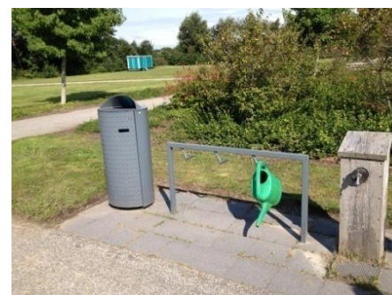
Op begraafplaatsen voldoet de locatie van de afvalbakken, echter de inwerpopening is niet optimaal