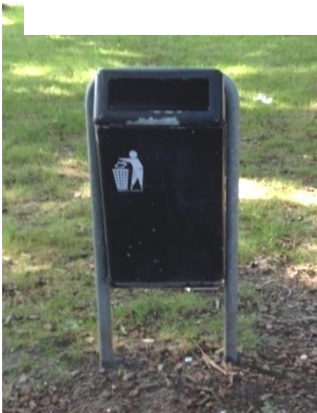
De afvalbak die als standaard toegepast wordt in Tynaarlo