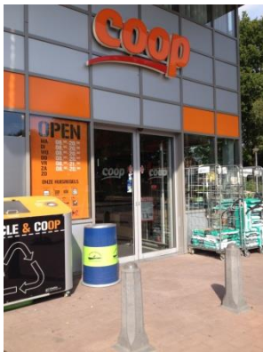
De supermarkt heeft zelf ook een afvalbak bij de opening neergezet