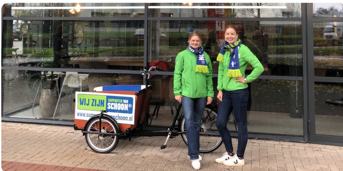
Schoonhostteam op het Hoendiep.

De informatie die het schoonhostteam ophaalt, is input voor het gesprek met de stakeholders in stap 4 (fase 2).