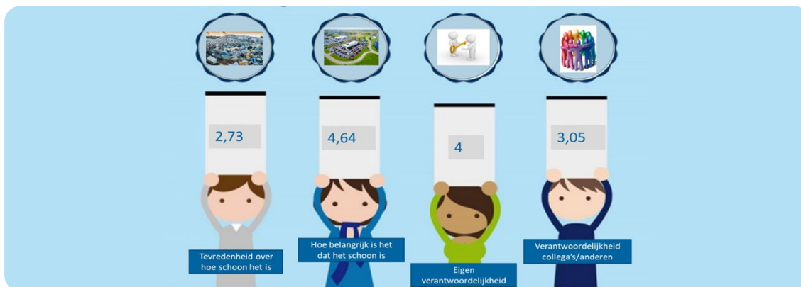
Voorbeeld resultaten enquête

Naast de objectieve meting in stap 1, waarbij je bepaalt hoeveel zwerfafval er daadwerkelijk ligt, is het waardevol om van de lokale ondernemers te horen hoe schoon zij het terrein vinden en wat zij zelf doen om het schoon te houden. Dit vraag je uit in een korte vragenlijst die je verspreidt onder de ondernemers op het bedrijventerrein. Ondernemers kunnen op een 5-puntsschaal aangeven hoe ze hier tegenaan kijken.