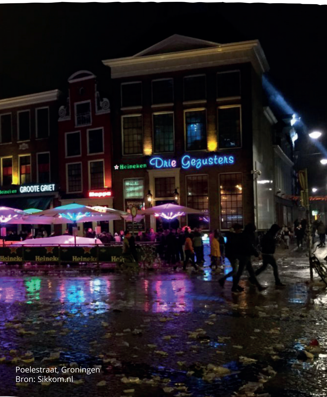
Poelestraat, Groningen