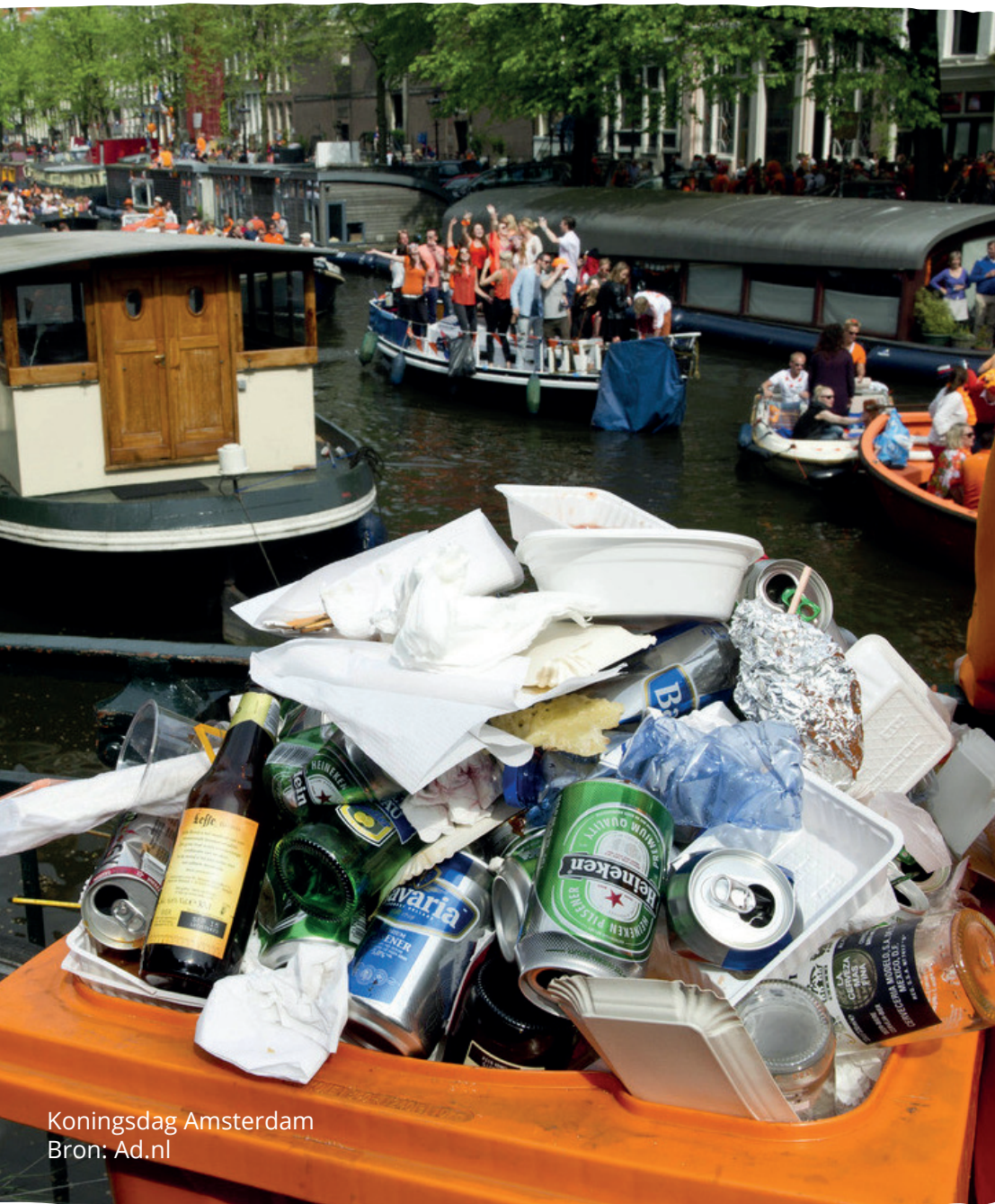
Koningsdag Amsterdam