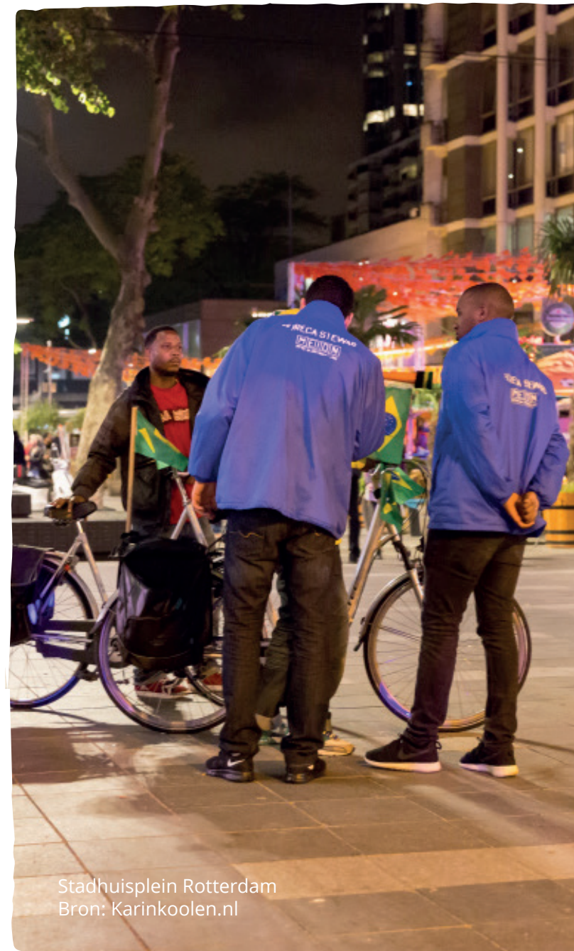
Stadhuisplein Rotterdam