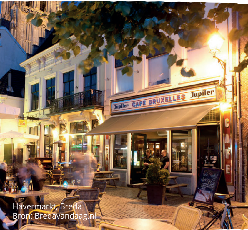
Havermarkt, Breda

Vervolgens kan het vraagstuk nader geduid worden door gezamenlijk een schouw te organiseren waarbij de situatie geobserveerd en beschreven dient te worden. Desgewenst kan hierbij een gespecialiseerde partij worden ingeschakeld die het proces faciliteert. Daarmee kan voorkomen worden dat de belanghebbende partijen naar elkaar gaan wijzen en elkaar betichten van ongewenste sturing van het proces. Belangrijk is dat na de probleemanalyse alle betrokkenen hetzelfde beeld hebben van het probleem en de oorzaken en er draagvlak is voor een gezamenlijke aanpak.