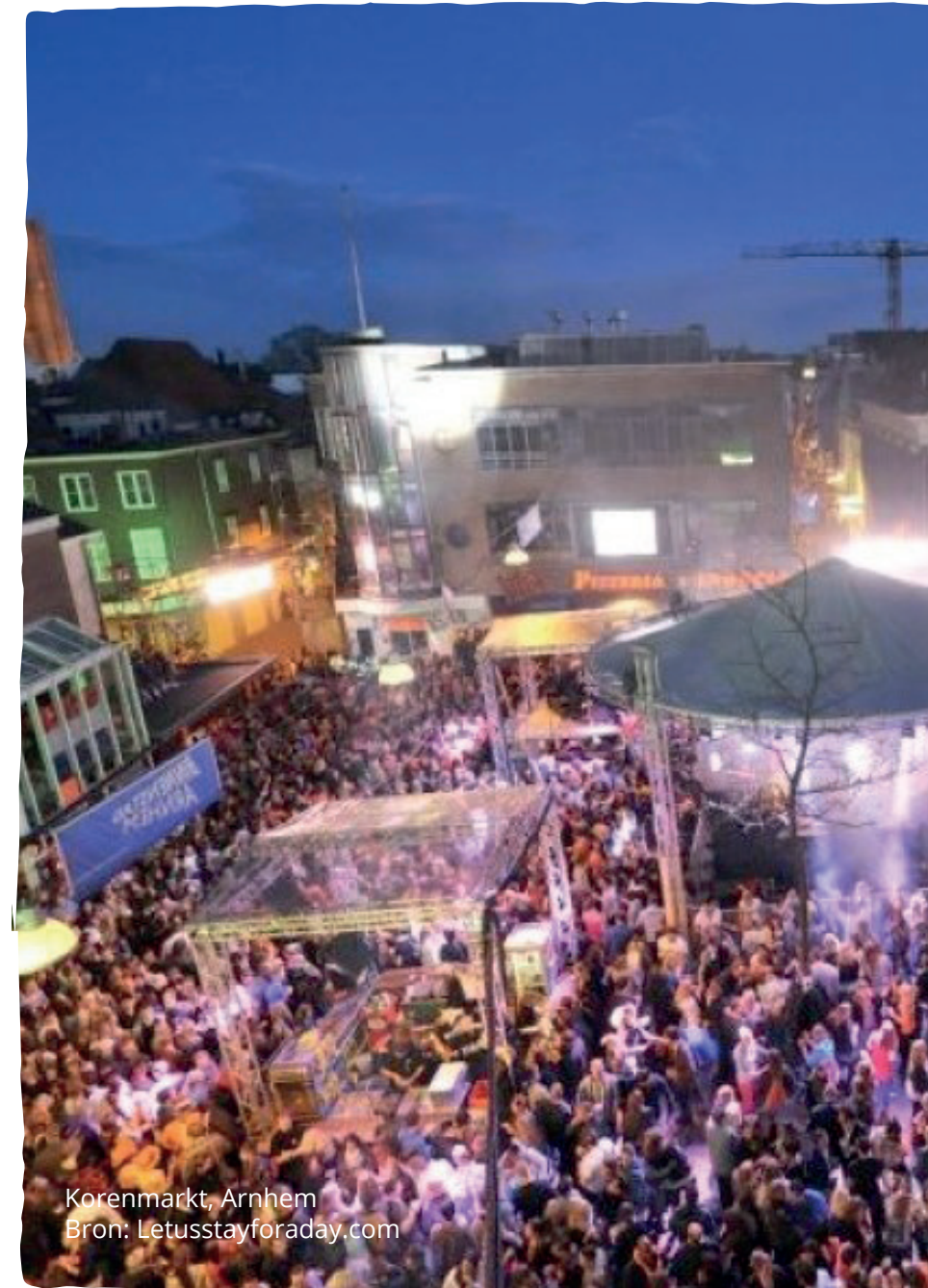
Korenmarkt, Arnhem

Veel kennis en materialen die ontwikkeld zijn voor de aanpak van zwerfafval bij evenementen kunnen ook toegepast worden bij uitgaansgebieden. Bekijk op de KenniswijzerZwerfafval.nl daarom de Gouden Tips en kennisdocumenten .