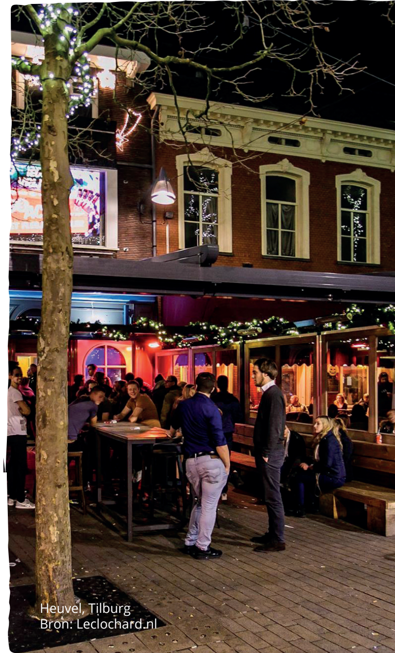
Heuvel, Tilburg

Bezoekers kunnen vaste klanten zijn, maar ook toeristen of andere incidentele bezoekers. De mate van binding die een bezoeker heeft met het gebied is vaak bepalend voor hoe zij zich gedragen. Bezoekers kunnen bijdragen aan een schoon uitgaansgebied door zelf geen zwerfafval te veroorzaken of gedrag te vertonen wat zwerfafval kan veroorzaken. Bijvoorbeeld door geen glazen of eten mee naar buiten nemen, maar binnen te consumeren. Ook kunnen bezoekers afval van anderen oprapen of anderen op hun gedrag aanspreken.