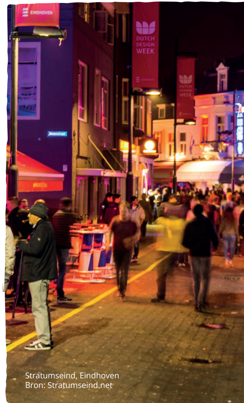
Stratumseind, Eindhoven

De gemeente heeft veel invloed op het beheer en de inrichting van de openbare ruimte rondom uitgaansgebieden. Daarom kan de gemeente via goed beheer en slimme inrichting veel problemen verhelpen. Vanuit beheer kan gedacht worden aan zichtbaar reinigen, tijdige lediging van afvalbakken, en schone inzameling. Vanuit inrichting heeft de gemeente bijvoorbeeld invloed op de hoeveelheid, vormgeving en positionering van afvalbakken. Tevens kunnen ook andere elementen in de inrichting invloed hebben op gedrag, zoals de positionering van verlichting.