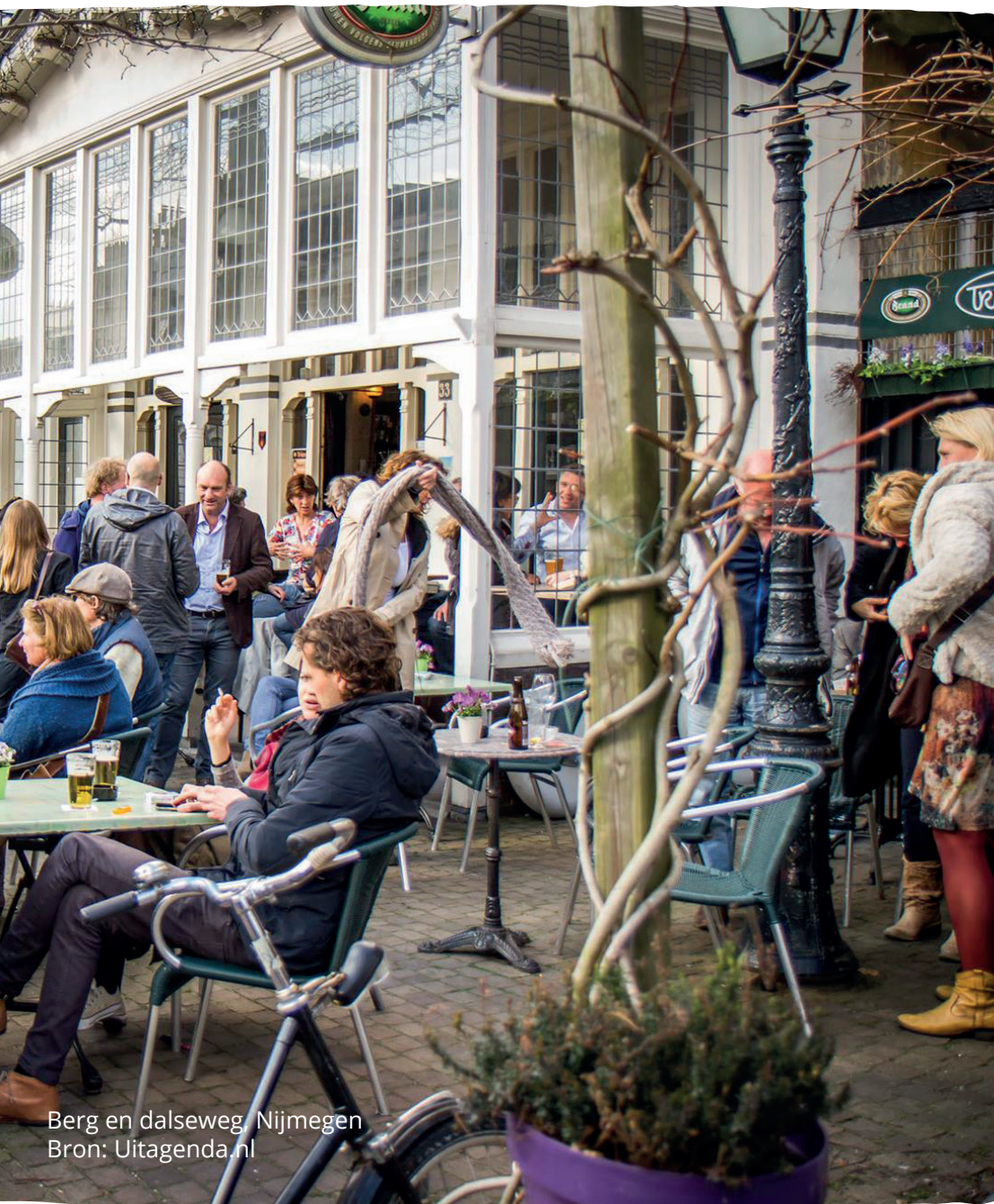
Berg en dalseweg Nijmegen

Daarnaast kan de gemeente het gedrag van bezoekers beïnvloeden door communicatie of de inzet van handhaving. Of kan de gemeente via wet- en regelgeving ondernemers dwingen tot maatregelen. Afspraken zoals het niet meer gebruikmaken van plastic lepels of per stuk verpakte koekjes zou de hoeveelheid afval kunnen verminderen.