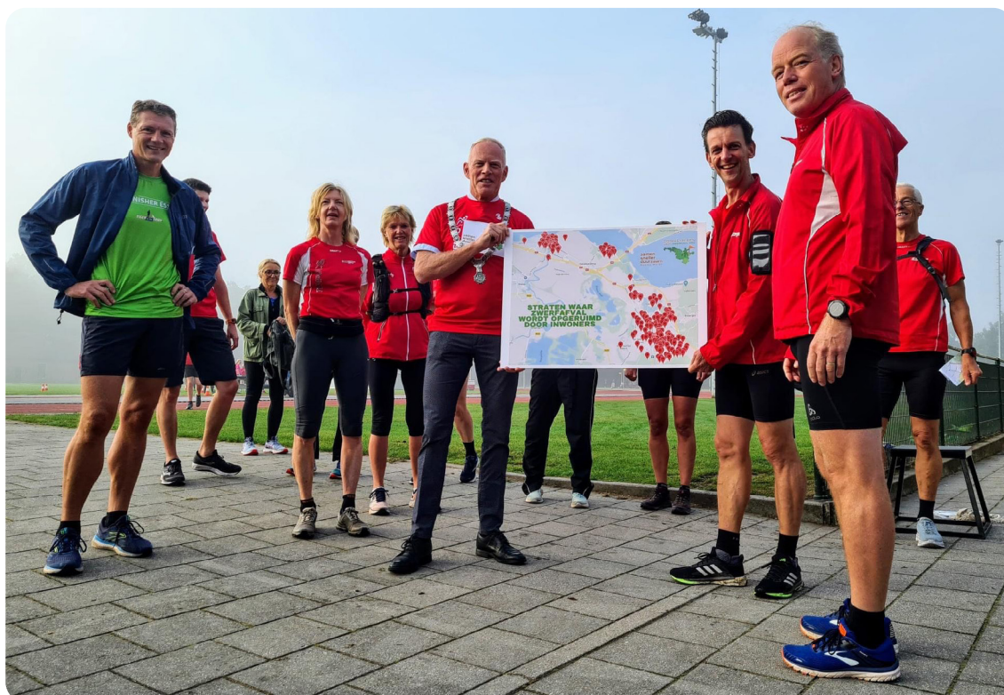
Gebiedsadoptanten in gemeente Gooise Meren.