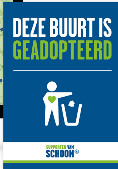
Voorbeeld afbeelding SvS Schoonkaart met adoptiegebieden

Adoptiesticker en poster, verkrijgbaar via de webshop