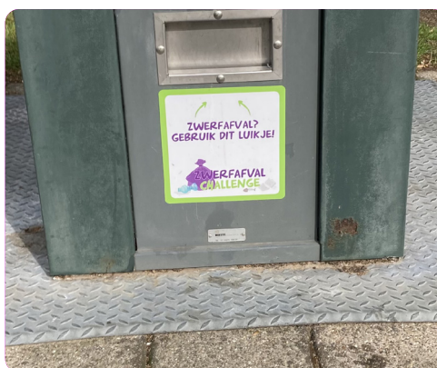
Zwerfafvalluikje vrijwilligers Gemeente Bodegraven-Reeuwijk