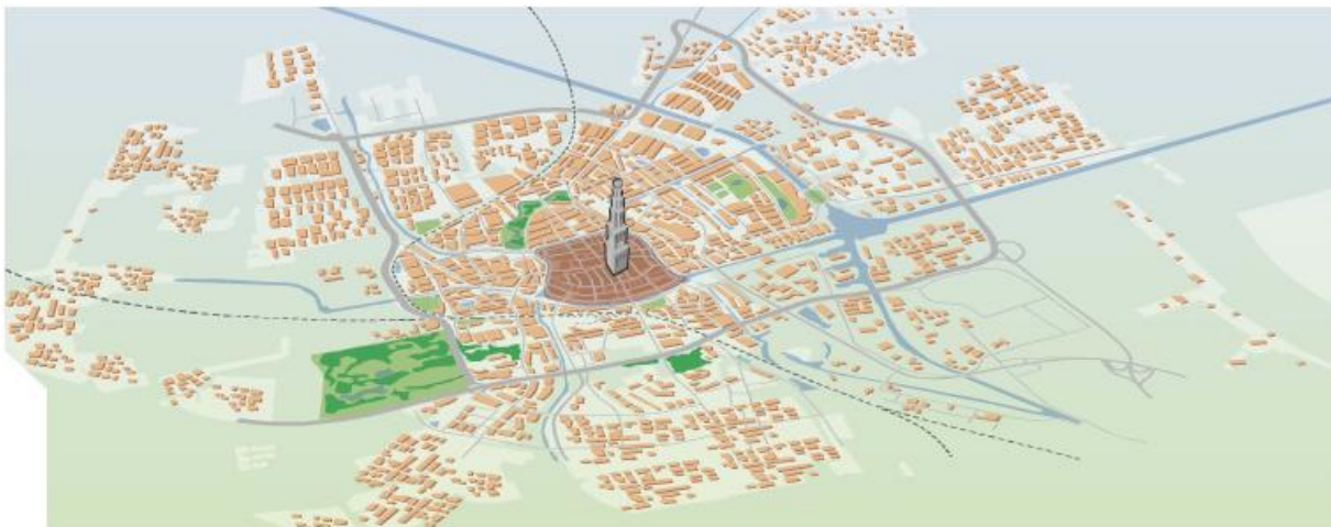
Figuur 1. Overzichtkaart Groningen-Stad

Groningen is een zeer sterk stedelijke gemeente (stedelijkheidklasse 1), met meer dan 190.000 inwoners.