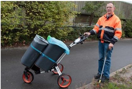
Handkar voor het gescheiden inzamelen van zwerfvuil (Cambio Deventer)