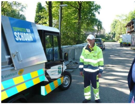
De 'elektrische kipper' is de voorlopige keuze voor het reinigingsvoertuig voor het Clean Team