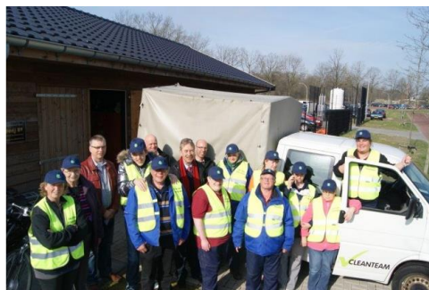
Figuur 1 Materieel van het Clean Team in Leek / Zuidhorn

Uit ervaringen van betrokken organisaties en bewoners/winkeliers en burgers blijkt dat de Clean Teams en projecten een positief effect hebben op gedragsbeïnvloeding en beleving, hoewel een objectieve meting van het bij de meeste projecten ontbreekt. Onderzoek toont aan dat het laten zien van straatreinigers in actie een positief effect heeft op burgers. Mensen blijken minder geneigd om rommel op straat te gooien en houden zich meer aan regels en zijn zelfs vriendelijker. Uit het onderzoek naar verschillende 'zichtbaar reinigen'-projecten is er geen verband aangetoond tussen de gemaakte kosten en behaalde resultaten (Giraf Results, 2010).