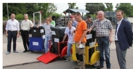
Bakfietsen van de Gemiva-SVG Groep, reinigingsdienst van de gemeente Binnenmaas

Naast het gedrag, verandert ook de beleving van burgers na het zien van een reiniger. Dit lijkt onbewust te gebeuren. 74% van de ondervraagde bewoners in Utrecht geeft aan de reiniger niet gezien te hebben, maar beoordeelt de omgeving wel schoner dan de mensen die uit de zelfde en precies even schone omgeving komen maar dan zonder zichtbare reiniging. Zichtbaar reinigen draagt tevens bij aan een positief beeld over de gemeente.