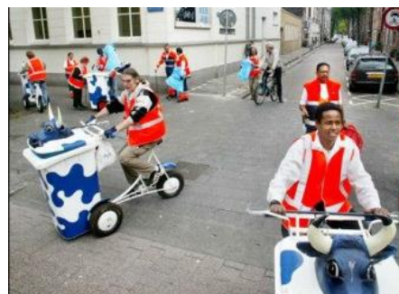
Gemeente Rotterdam zet speciale 'cowtainers' in op winkelcentra en bij evenementen. De 'cowtainer' bevat een knijper én kan een loeiend geluid maken (extra aandacht trekken)